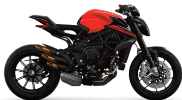
ROSSO AGO/NERO CARBON METALLIZZATO